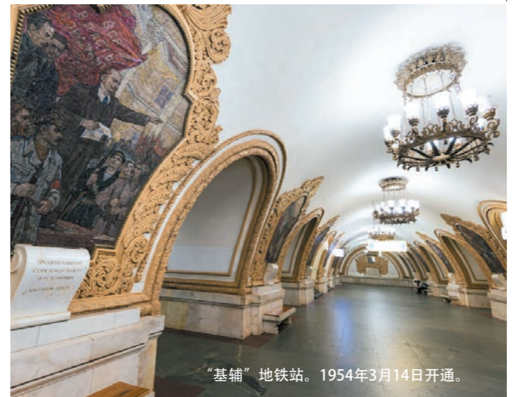
“基辅”地铁站。1954年3月14日开通。