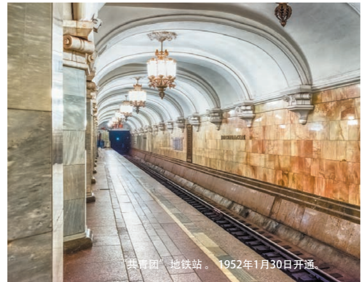
“共青团”地铁站。1952年1月30日开通。