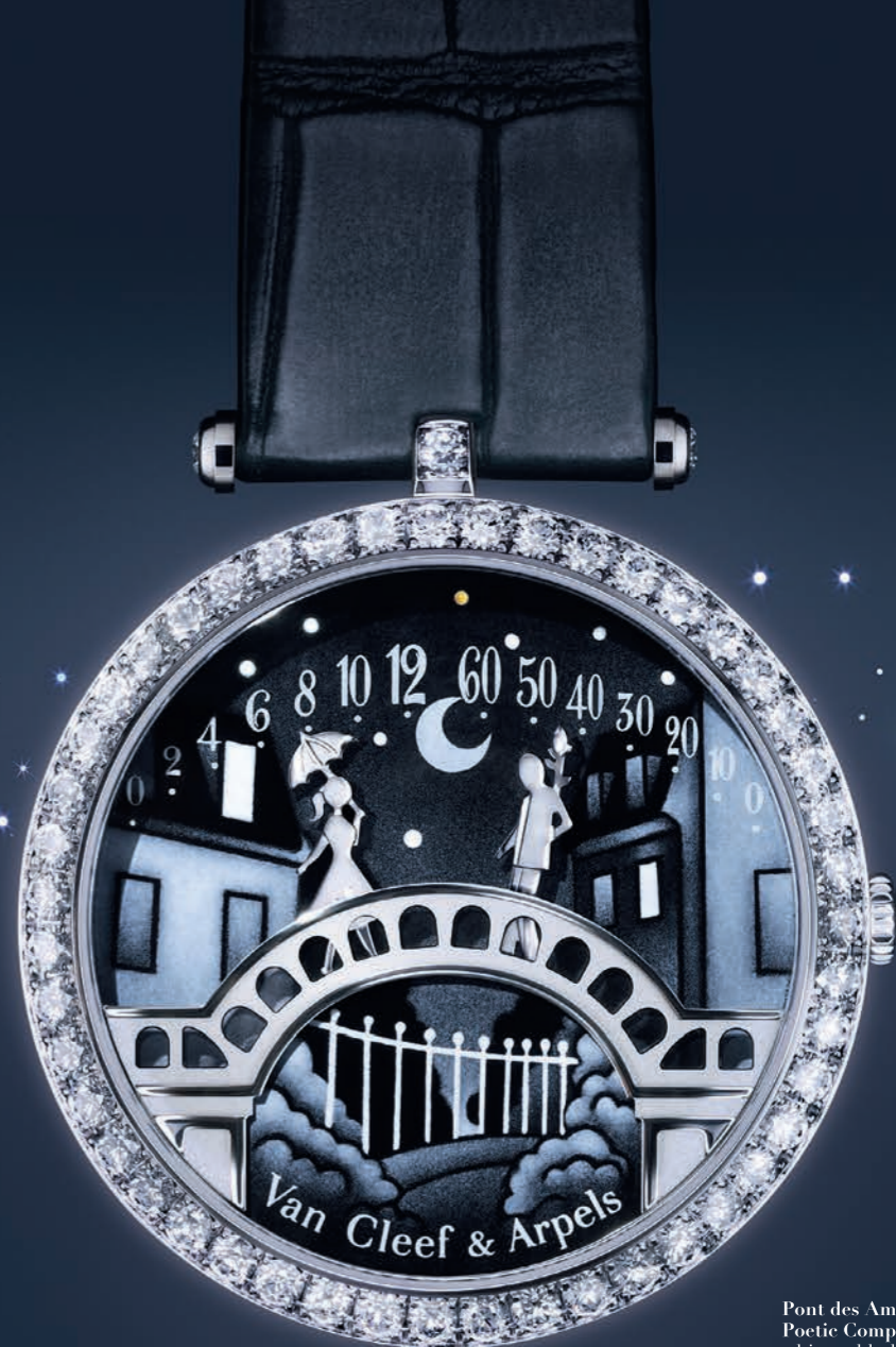
Pont des Amoureux Poetic Complications watch white gold, diamonds, "contre-jour" enamel, mechanical movement with retrograde hours and minutes.

鞋类/附件 地址: 红场, 3号, 古姆 (GUM) 1线, 2楼(猎人商行地铁站) 电话号码: + 7 (495) 221-6767